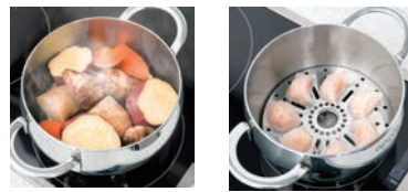
⑧スチームスタンド